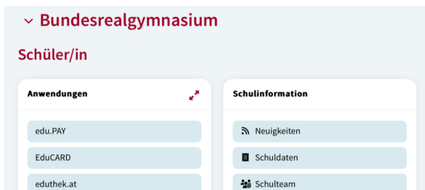
Abbildung 12: „edu.PAY“ wählen

Wählen Sie anschließend den Button „edu.PAY“.