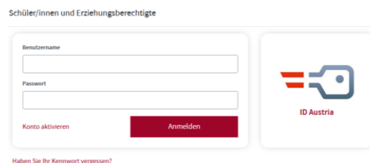
Abbildung 3: „Konto aktivieren“ oder „ID Austria“ wählen

Klicken Sie zunächst auf „Konto aktivieren“.