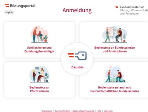
Abbildung 2: „Schüler/innen und Erziehungsberechtigte“ wählen