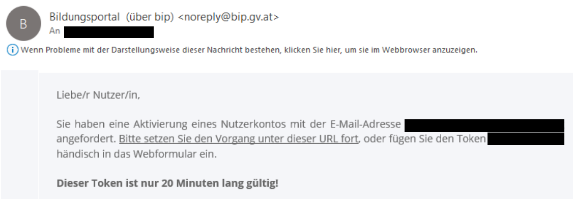
Abbildung 5: In der E-Mail dem Link folgen oder den Token in das Webformular eintragen