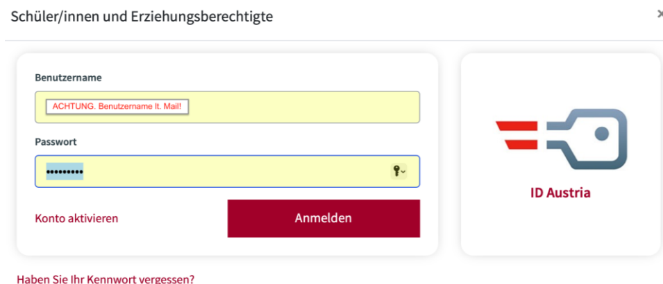
Abbildung 11: Anmeldung mit Benutzername und Passwort

Nachdem Sie die Webseite www.bildung.gv.at geöffnet haben, melden Sie sich jetzt mit Ihrem Benutzernamen an.