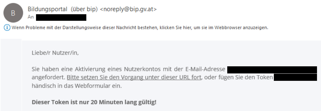
Figure 5: Follow the link in the e-mail or enter the token in the web form