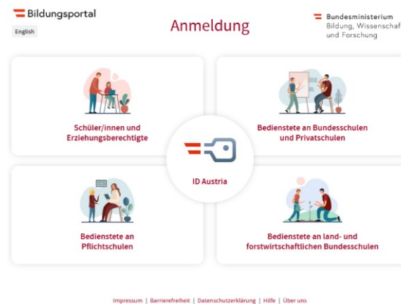
Figure 2: Choose „Schüler/innen und Erziehungsberechtigte“